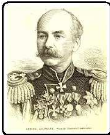
Hywa Türkmenlerini gyran, Türküstanyň ilkinji harby gubernatory rus generaly Fon-Kaufman

General Kaufman! Bu «şöhratly» ady kim bilmeýär! Kaufman—arzuw bilen ýatlanýan patyşa zamanynyň--«azat ediji patyşanyň» döwrüniň «wasp edilen ganhory»! Ol—patyşanyň baýary hem halany. Kaufman—O.Aziýany basybalyjy, geni, iň bir ynsanperwer/gumanist hökümdar hökmünde öwgüsi ýetirilen, rowaýatlara siňen general.