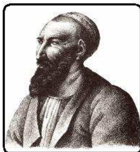
Kiyat han. Muraviyevniň çeken surati