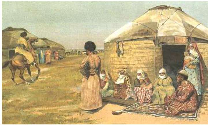
Hiwa ýomutlary (Rodina jurnalı. Moskva 10/2006)

«İçalylar uly otrýadlar geçirilýärdi, gaty köp çykdaýjysy bardy. Bu otrýadlar düýe baryny gyrdylar, Türkmenleri tozdurdylar, şeýdip bu wagşylarda bize garşy elhenç duşmançylyk döretdiler, şol hem soňra Kawkazlylaryň Hywa ýörişini puça çykardy» (69-njy sah.)