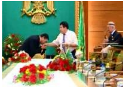
Berdimuhamedov, Nyýazovyň elini öpýär