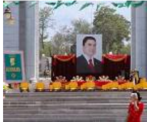
Çärjewiň bir meýdanyndan Nyýazovyň heýkeliniň ýerine “häzirikçe” G.Berdimuhammedovyň uly protreti goýuldy.