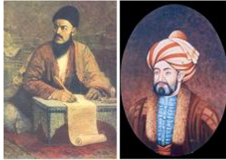
Magtymguly we Ahmet han Andaly - Dürrany (1723–1773)