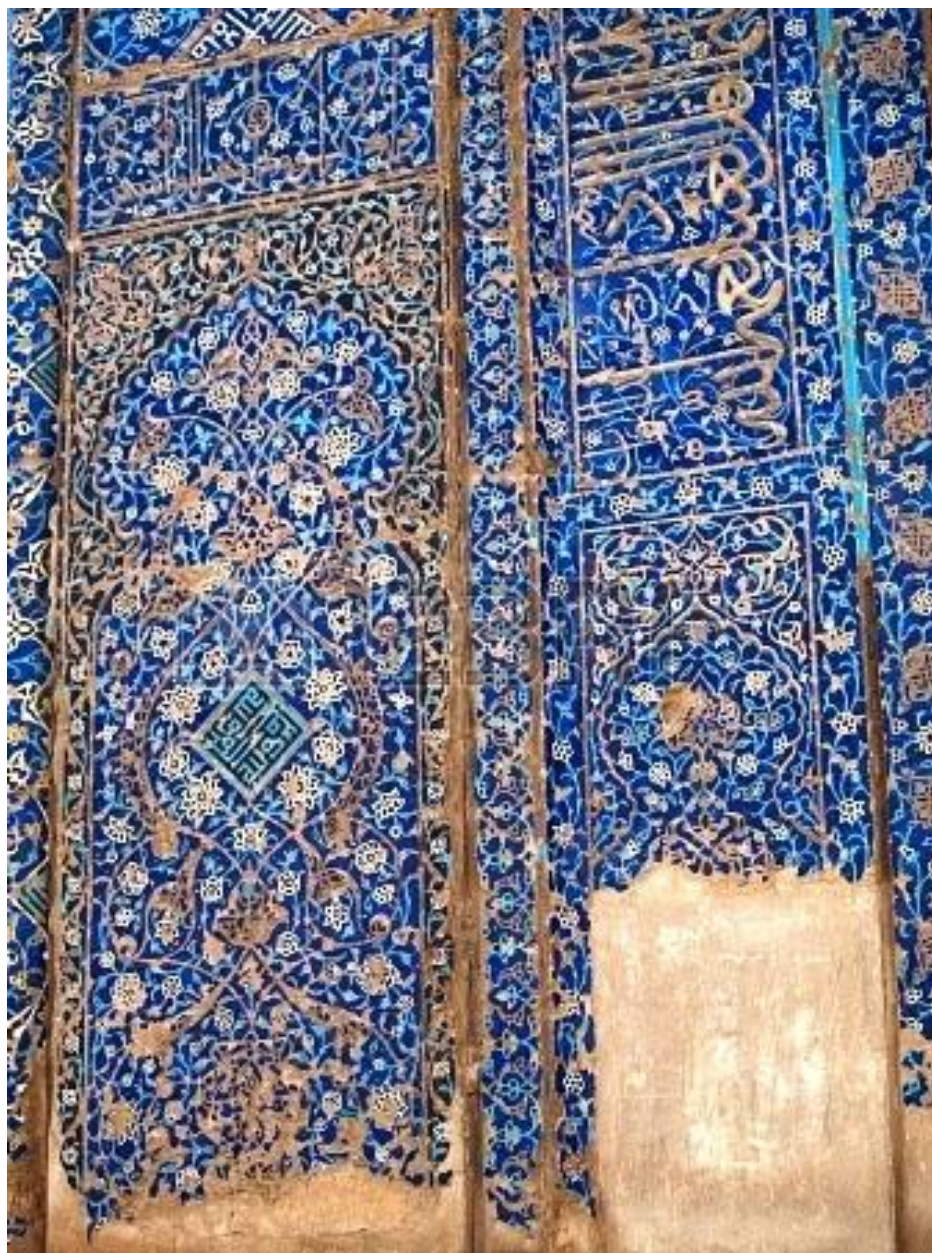
مسجد گؤک معماری در اسلیمی زمینه یک در ثلیث خط به مزین رفته بکار های کاشی