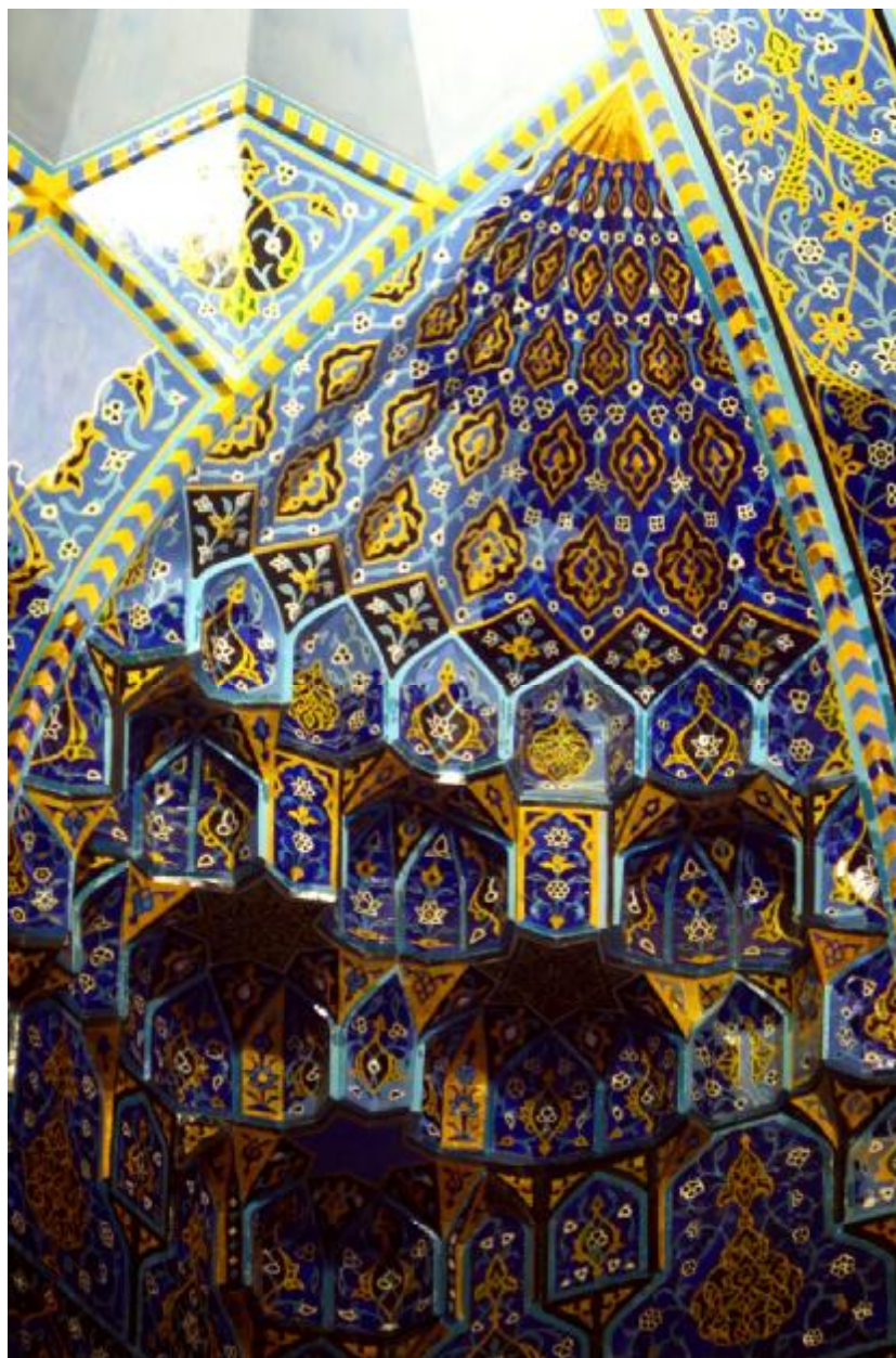
اسلامی معماری سبک به ایی فیروزه زیبای کاشیکاری