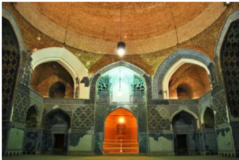
بنا درونی سقف