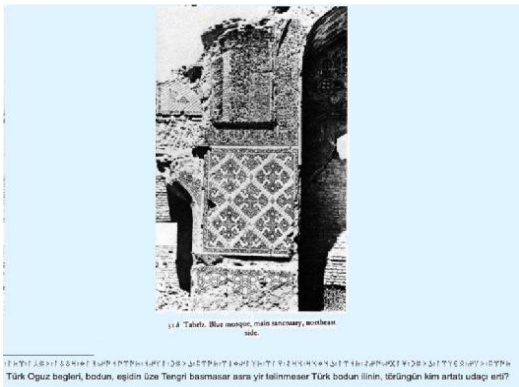
ستون ورودی مسجد در سمت شمال شرقی آن

خطوط و علائم تصویر زیر را با علامات سنگ نوشته های اورخون یئنی سئی و بیلگه قاغان مقایسه کنید.