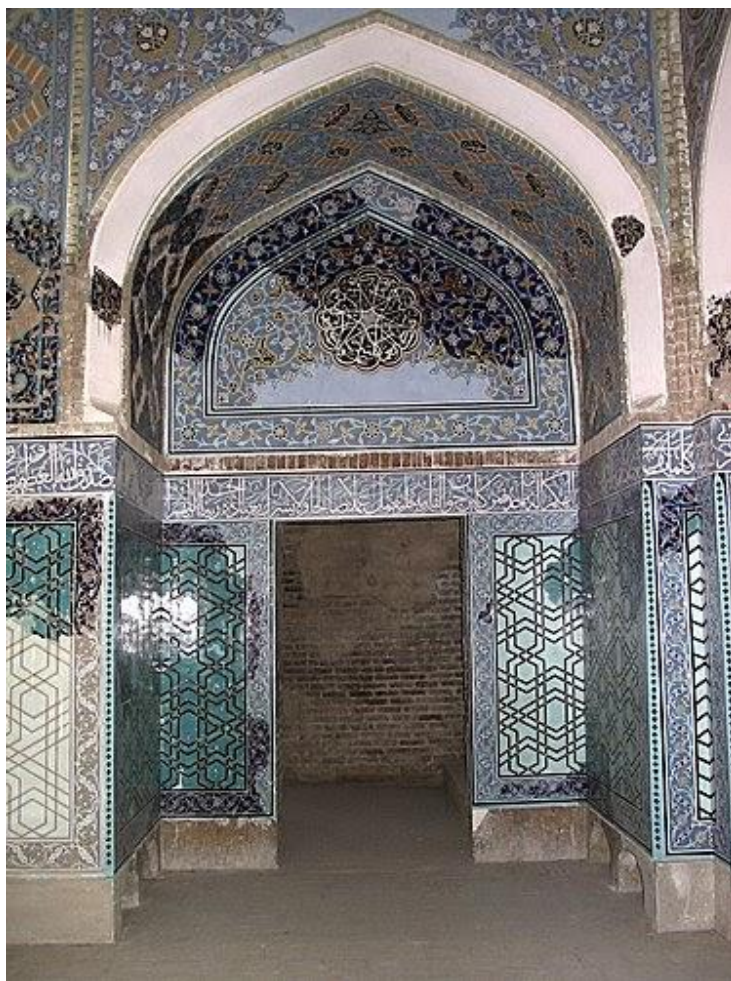
جهانشاه مقبره بطرف درونی درب