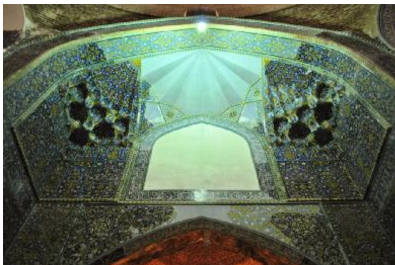
اصلی درب به مشرف طاق سقف فوقانی گوشه بخش