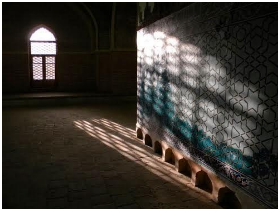
حقیقی جهانشاه دفن محل