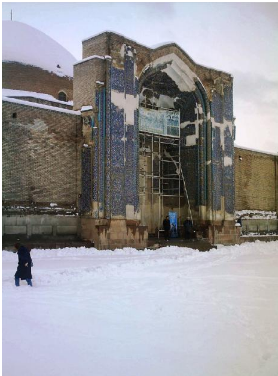
مسجد گؤک ورودی درب نمای