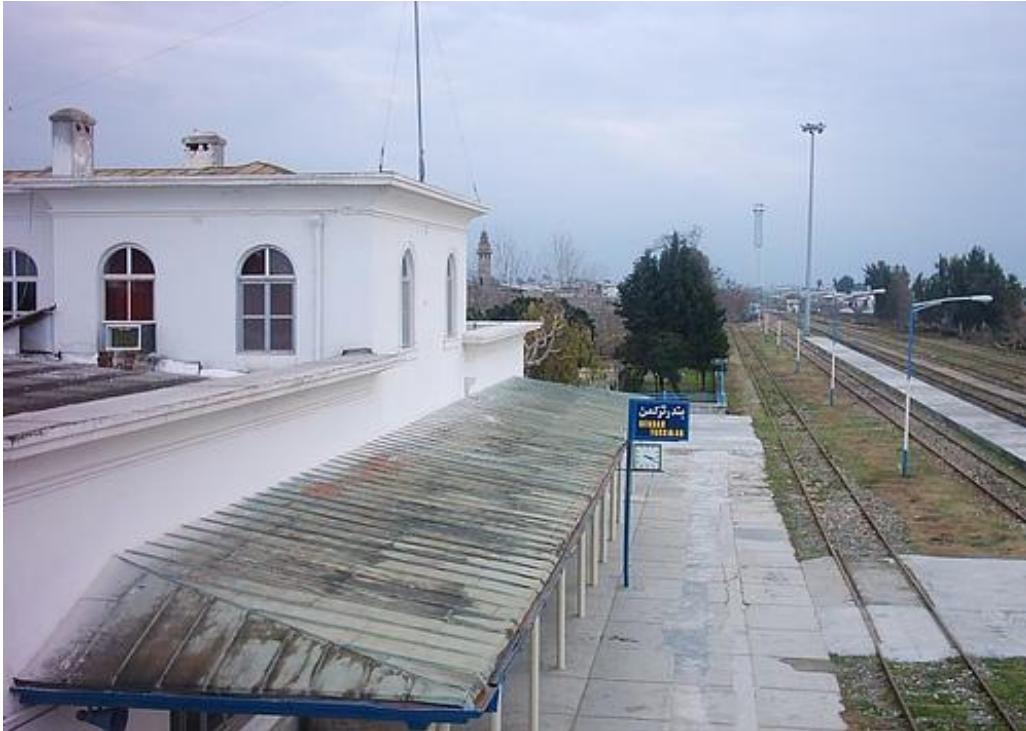
* Bendertürkmen şäheriniň demirýol duralgasy

Bu port şäherinden Gülistan welaýatynyň deňiz söwda eksportlarynyň köpüsini Türkmenistan bilen Gazagystana ýollaýar. Şeýle hem bu şäher balykçylyk Şilat edarasynyň tarapyndan gyzyly balyk işbil önümleriň iň köpüsi öndürilýär. Bendertürkmen şäheri Orta Aziýa ýurtlaryna iň ýakyn port şäherleriniň biri hökmünde onda demirýol enjamlary hem regiýon boýunça eksport göýberiji gurby, nebit we oňa degişli materiýalary tranzit etmäge ähmiýeti has ýokarlanýar. Bendertürkmen şäheristanynyň welaýat häkimi Agaýe Akberi şeýle diýýär: “Deňziň özegini (Deňziň ýörite çuňlaşdyrylan uly gämileriň ýöreyän, bellik edilen marşrudy) çuňlaşdyrma çäreleri ýerine ýetirilenden soň 500 tonna agramly gämileriň gel-gidi başlanar”.[ 15 ] ۱۱۰