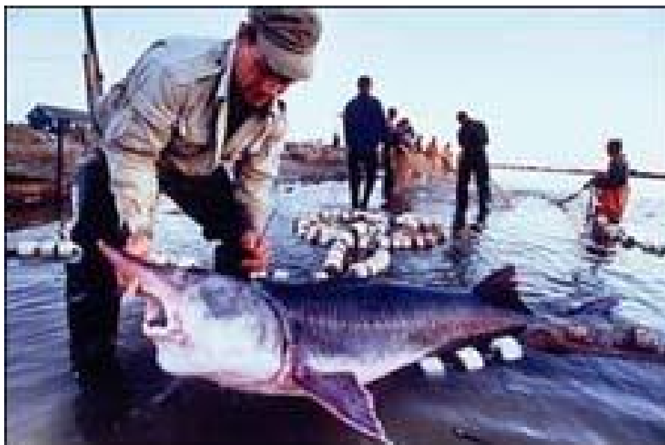
* Tora düşen balyklaryň göwrümi