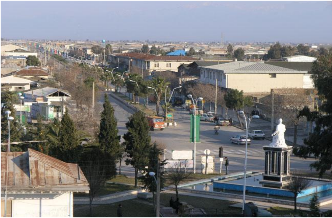
* Bendertürkmen şäheriniň merkezi meýdançasy.

Bendertürkmen şäherini häzirkä zaman, umumy maglumatlarda şeýle görkezilýär: “Gülistan welaýatyna tabynlykda duran Bendertürkmen şäheri, Türkmenistanyň has Günbatar çünkinde ýerleşen türkmen şäherleriniň biri dir. Bendertürkmen şäheri, ýurt tabynlygynda “şäheristan” ölçeginde “Türkmen şäheristany” ady bilen şäheristan merkezliginde durýar. Bu merkezlige Kümüşdepe ş., Siminşäher(öňki “Gargy” we “Omçaly şş.)” we Bendertürkmen ýaly şäherler onuň tabynlygynda durýar. Onuň şäheristan derejesinde umumy sany 200 nün adam bolsa, 90% göterimi Eýranly türkmenlerden ybarat bolýar. Bendertürkmen şäheri 1306 h.ş. ýylynda Reza şanyň tarapyndan düýbi tutulyp, “Benderşa” ady bilen tanalýardy. Bu şäheriň ady 1979-njy ýyl Eýran ynkylybyndan soň türkmenleriň talabyna görä “Bendertürkmen şäheri” diýilip atlandyryldy.