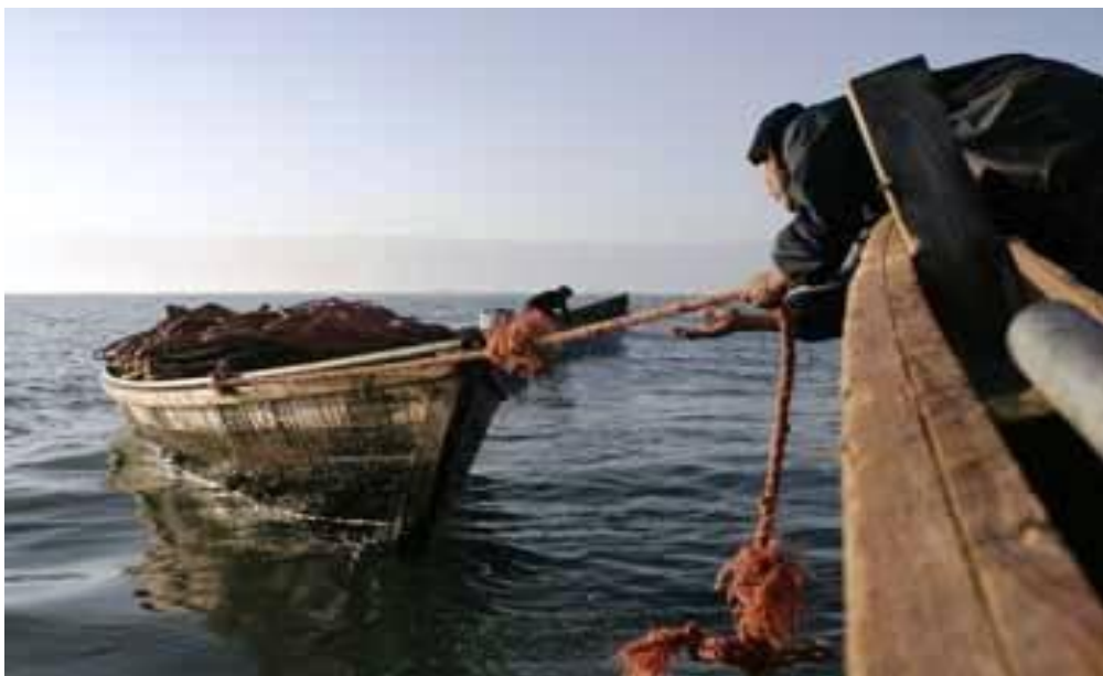
* Türkmen balykçylary zahmet üstünde

Balykçylyk nokatlary Esenguly etrabyňyň serhedinden başlanypdyr. Garasuw we Aşyrada-da Şilat edarasynyň birinji gezek düýbi tutulýar.