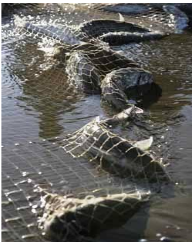
* Garatorda süzguçleri bilen süzülip alynýan kfal balyklar. Olara “Çontaly” ýa-da “Garabalyk” hem diýilýär.

J – Ýaşlar hakda onuň pikir etmekligi welawelaatyň degişli başlyklaryndan isleýärin. Ýagny ýaşlar esasan näme isleýärler? Meniň özüm köp ýaşlarymyzyň köp sanly işsizlikden azap çekýändiglerini ýakyndan görýärin. Bileleşik awçylyk firmasyny (kooperativ) ayp hem ýaşlary işe meşgul etmeli, hem-de şonuň bilen birlikde ýurdyň ykdysadyýetine ýardam bermeli”.[ 13 ] 117