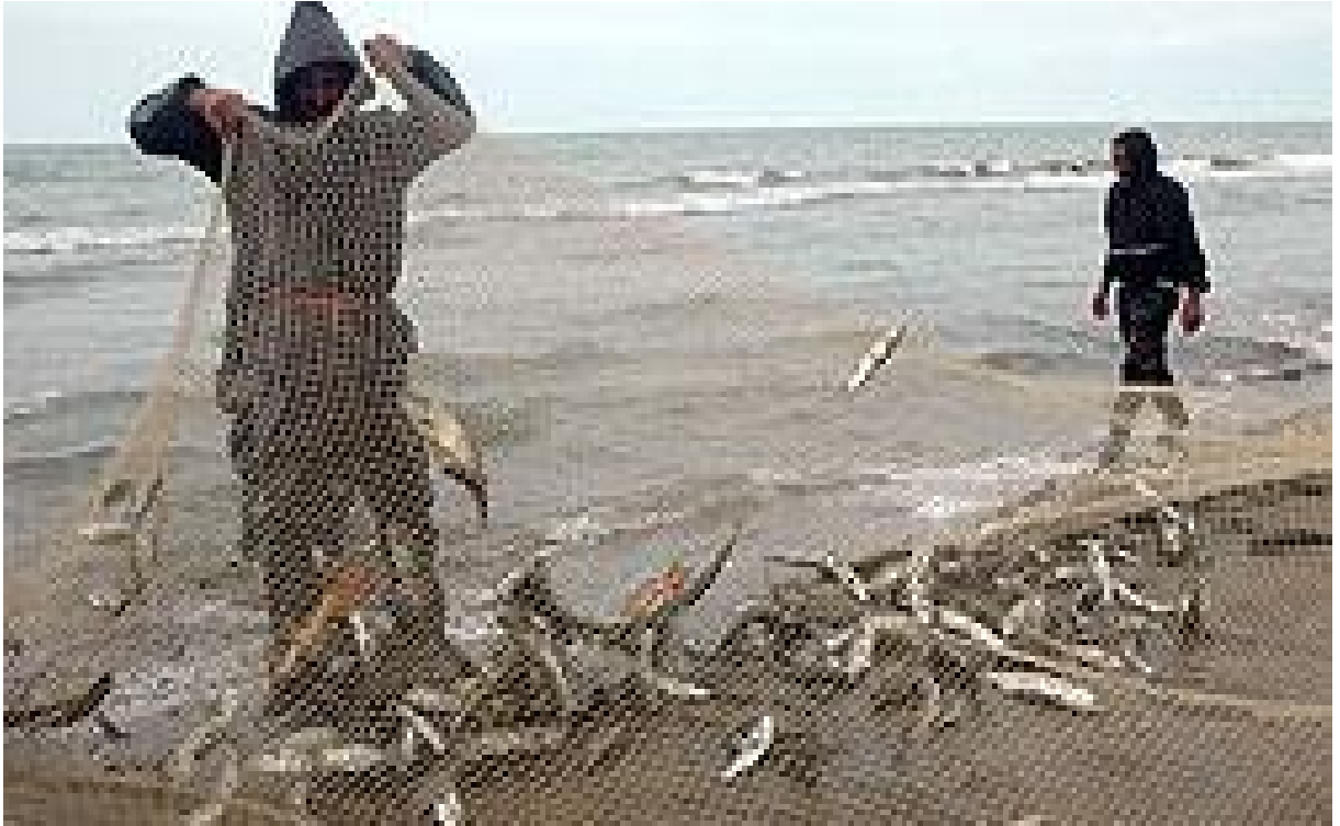
• Türkmen awandalary iş başynda

Gürgeniň kenar ýakasyndaky ýaşayan türkmenleriň balyk awçylygyny dolandyryşlary gaýraky Türkmenistanda bolşy ýaly, gadymy döwürlerden bäri dowam edip gelipdir. Irki döwürlerde balykçylyk edaralary köplenç, bir taýpanyň ýa-da bir tiräniň adamlaryndan ybarat bolupdyr. Ýöne häzirki döwürde, ýagny soňky 40 ýylyň dowamynda bu düzgün kem-kemdan aýrylyp, ähli zähmetkeş türkmen adamlar hem bu edaralarda işläp bilýärler.