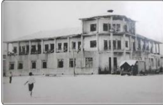
بندرتور كمنداكي دمكرات آدى بريلن ساختمان